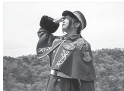
オーダーメイドの制服

細かなところまでルールに沿ってデザインしなくてはなりません。当社では通常警備の青色の制服とパフォーマンス用の赤色の制服を用意しています。ルールを守りつつ、当社の警備を見た人たちに楽しんでもらえるような制服に仕上げるために、警察署の方と相談しながら進めていきました。