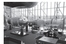
表紙写真 シリーズ「宇宙～限らない可能性～」 スミソニアン国立航空宇宙博物館 米国・ワシントンD.C.