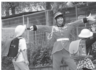
明るく元気な警備が評判

の働き方の相性が良いと思ったからです。舞台の本番が近づくと、劇団員は稽古のためにまとまった休みが必要になります。そのため正規の仕事に就くのは難しく、早朝や深夜のアルバイトをかけもちしている人が少なくありません。イベント会場でのパフォーマンス付き警備は、単発の勤務ですので、稽古日と調整しやすいです。1日の勤務時間は8時間など長いものが多いので、時給を高めれば、短い期間に集中して稼ぐことができます。複数のアルバイトをするよりも、仕事とプライベートにメリハリがついて、劇団の活動にも打ち込みやすくなると考えました。